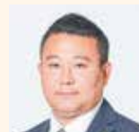
永島 弘通 (公明党)