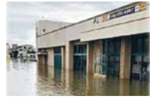
〈冠水により被害を受けた店舗〉