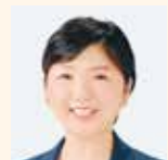
川上 多恵 (公明党)