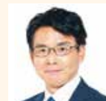
新開 崇司 (日本維新の会)