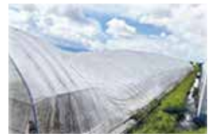
〈被災したイチゴハウス〉