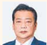
井上 寛 (公明党)