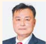
松下 正治 (公明党)