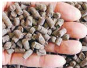
〈ペレット化した堆肥〉