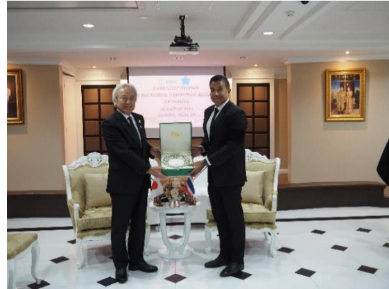
(都知事と記念品の交換)