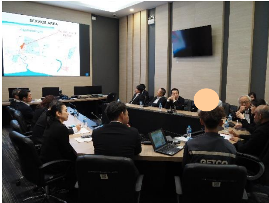
(概要説明及び意見交換)