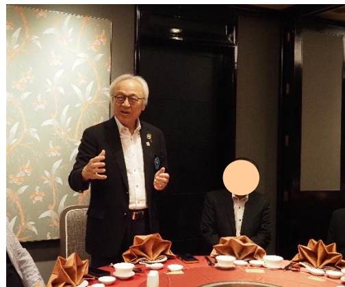
(挨拶をされる藏内議長と県人会会長)

参加議員と同郷の方もおられ、懐かしい話などで盛り上がり、親睦を深めることができた。