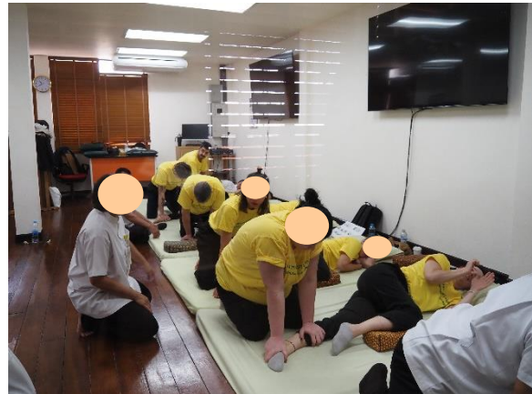
(実技の練習をしている様子)