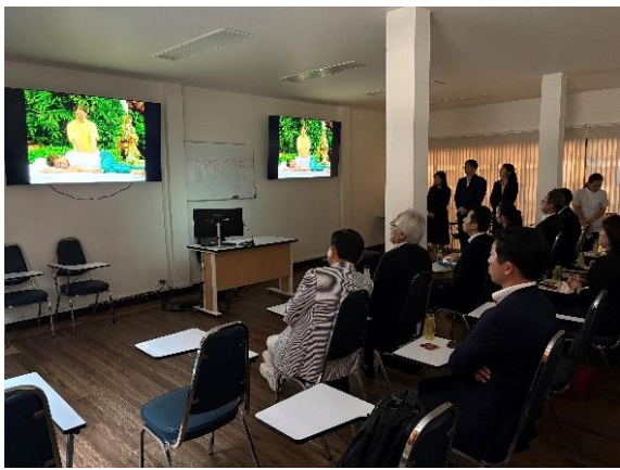
(タイ古式マッサージ概要説明)