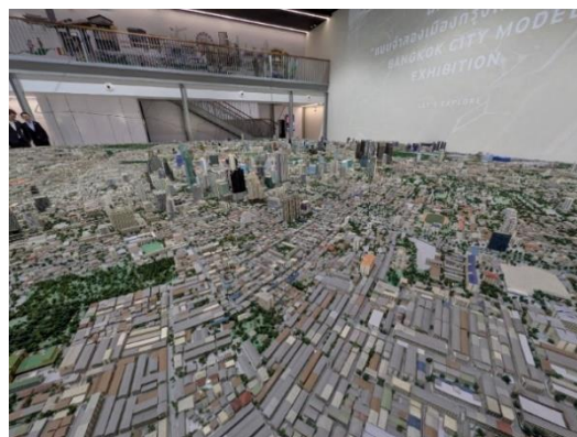
(設備内にあるバンコク都の巨大なジオラマ)