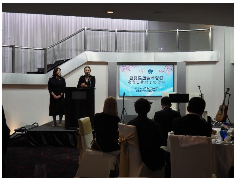
(スピーチを行う大田議員と豊福議員)