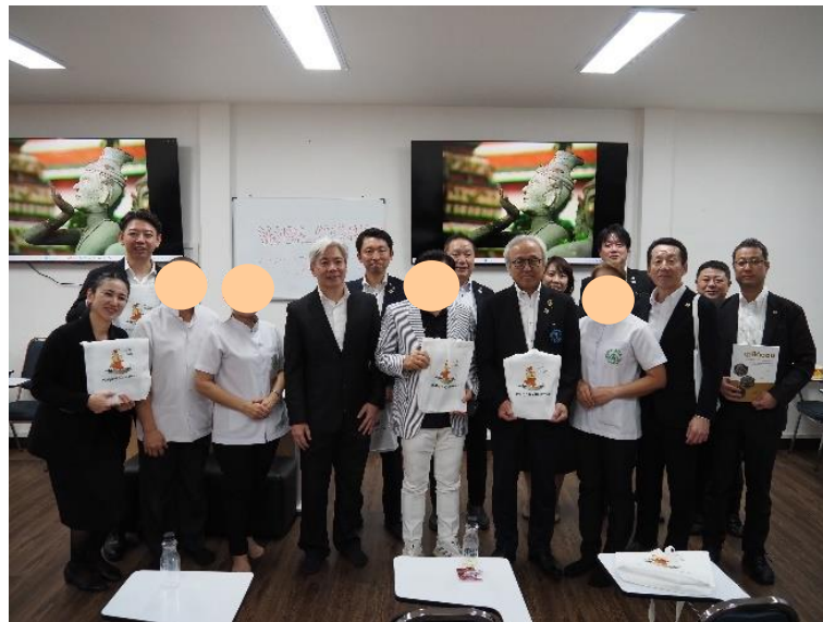
(マッサージスクールの皆様と)