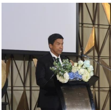
（チャチャート都知事挨拶）