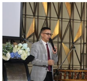
（スラジット議長乾杯挨拶）