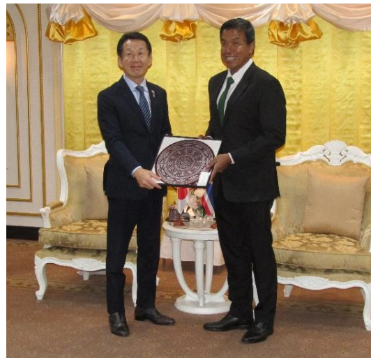
(都知事と記念品の交換)