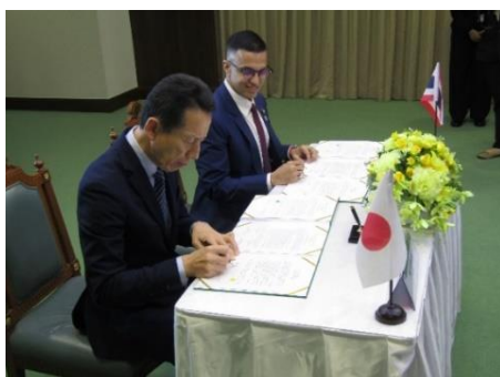
(協定に署名する両議長)