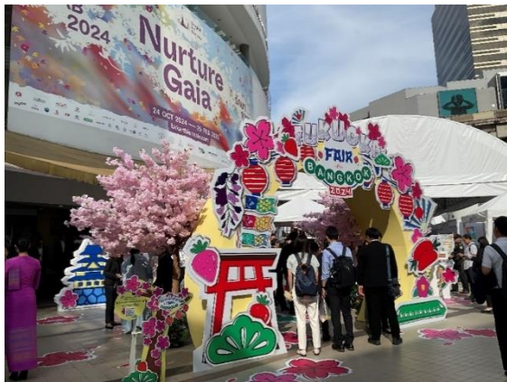
会場：バンコク都芸術文化センター