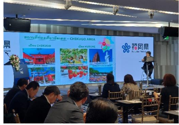
(観光セミナーの様子)