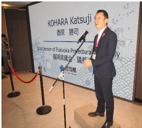
(香原議長乾杯挨拶)