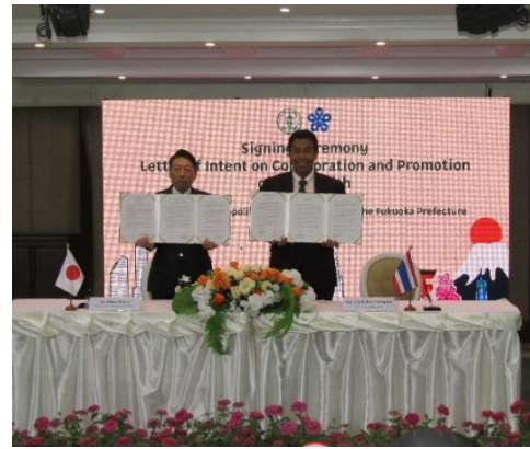
(基本合意書にサインする両知事)