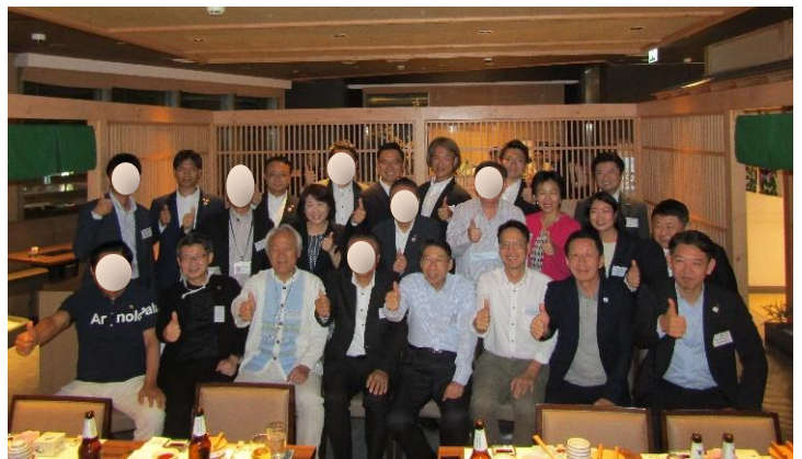
(県人会・OB会の皆様との記念撮影)