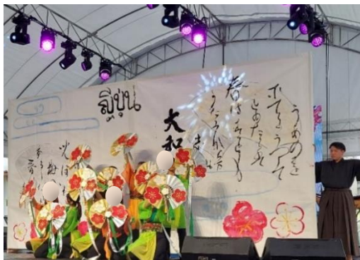
(書道パフォーマンス)