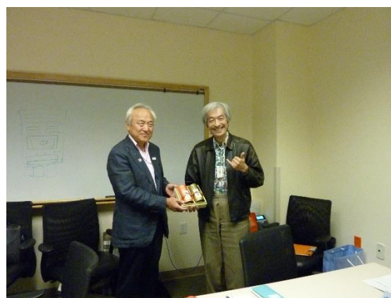
（サンドラ教授（左）と町教授（右）に記念品を贈呈）