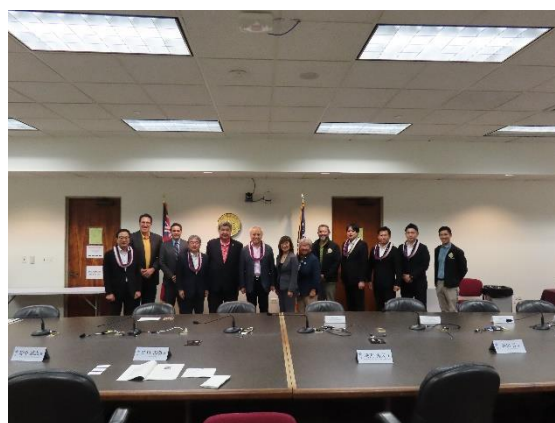
（ハワイ州議会議員と）