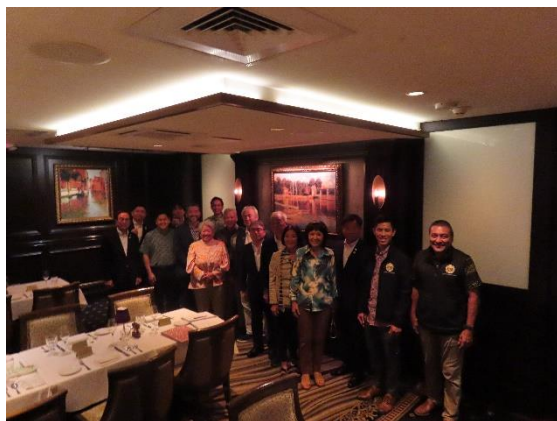
ハワイ州議会議員と