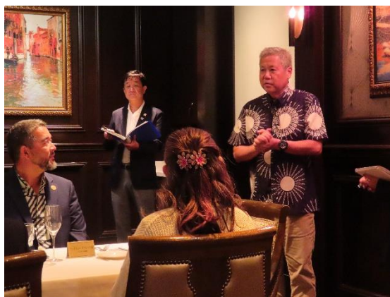
（スコット・サイキ元下院議長挨拶）