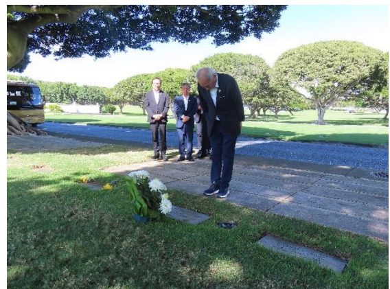
（エリソン・オニヅカ氏の墓前）