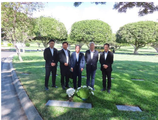
（ダニエル・イノウエ氏の墓前）