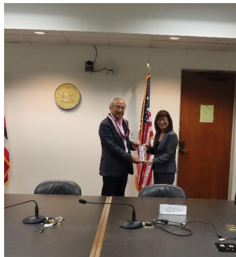
（ナカムラ下院議長へ記念品の贈呈）