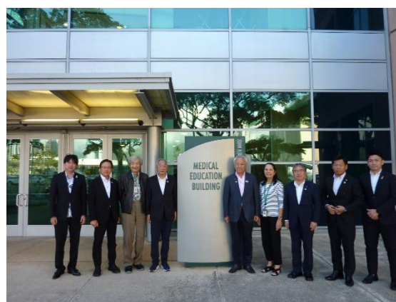
（サンドラ教授・町教授と）