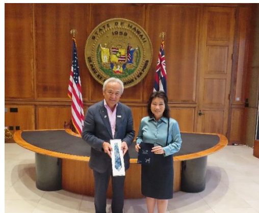
（ルーク副知事へ記念品の贈呈）