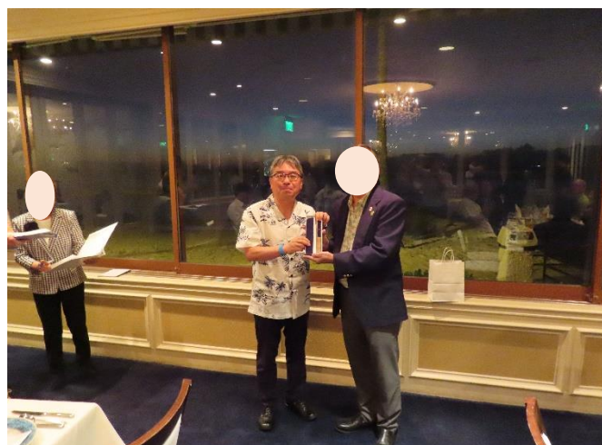
（県人会会長へ記念品の贈呈）