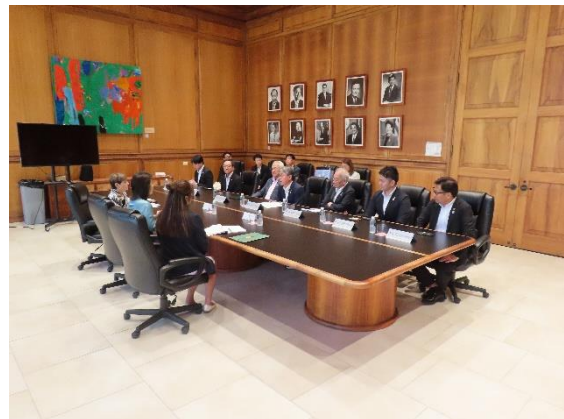
（表敬訪問中の様子）