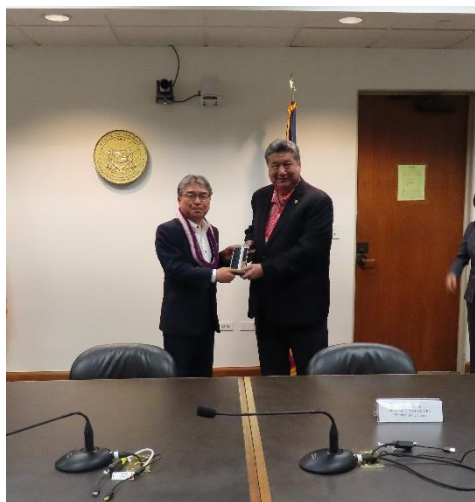
（コウチ上院議長へ記念品の贈呈）