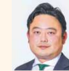
稲又 進一 (公明党)