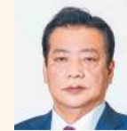
井上 寛 (公明党)