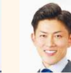
塩生 好紀 (日本維新の会)