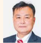
松下 正治 (公明党)