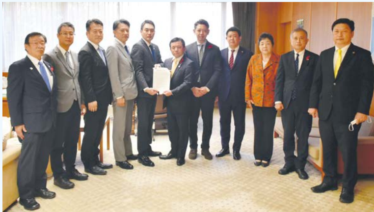
10月7日、議員提案政策条例検討会議は、取りまとめた条例案を桐明議長に報告しました。