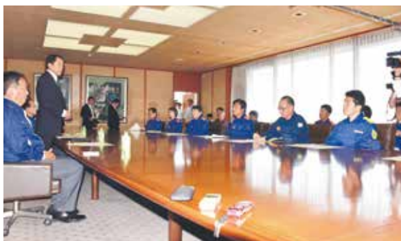
麻生副総理へ被害状況の報告と要望