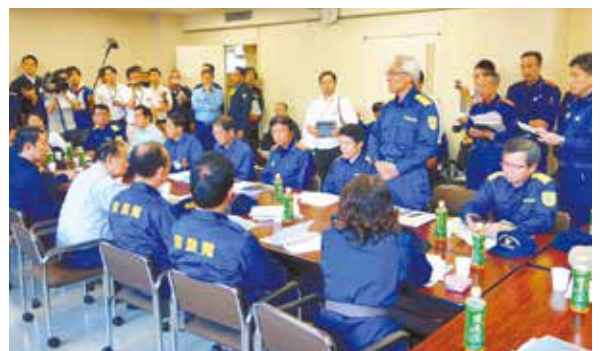
二階自民党幹事長(前列左から2番目)へ要望