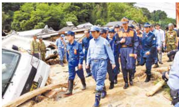
安倍首相(中央)と災害現場を視察