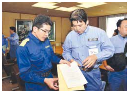
松本内閣府副大臣(右)に緊急申し入れ書を手渡す樋口議長

県内に甚大な被害をもたらした今回の「平成29年7月九州北部豪雨」については、7月21日、松本純防災担当大臣から、本県の朝倉市、東峰村、添田町、大分県日田市の4市町村を激甚災害に指定する見込みである旨の発表があり、これにより復旧・復興事業が迅速に進むことが期待されています。